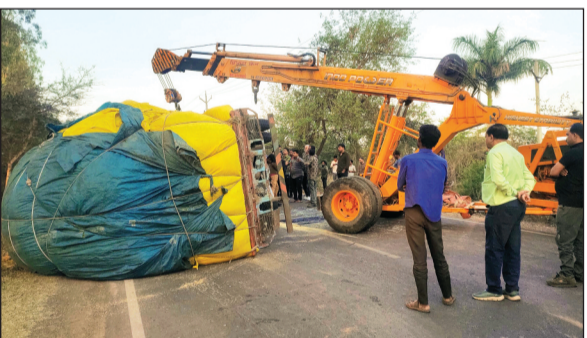
दूसरी घटना : सड़क हादसे में बाइक चालक गंभीर घायल

भोपाल-विदिशा हाईवे 18 पर हादसों का सिलसिला थमने का नाम नहीं ले रहा है। बालमपुर घाटी से लेकर कुल्हड़िया तक महज 5 किलोमीटर के दायरे में 5 दिन के अंदर 4 बड़ी दुर्घटनाएं सामने आ चुकी हैं, जिससे यह मार्ग अब 'हादसों का हॉटस्पॉट' बन गया है। रविवार-सोमवार की देर रात विदिशा से भोपाल जा रहा भूसे से भरा आईस ट्रक एमपी 09 जीएफ 1120 दीवानगंज के पास फ्लिक्कन गार्डन पूछी देही मार्ग के सामने हाईवे 18 पर अनियंत्रित पलट गया। जिससे रात 2 से सुबह 8 बजे तक हाईवे जाम लगाने से वाहनों की कतार लग गई। पुलिस ने ब्रेन मशीन की मदद से ट्रक को हटाया, तब जाकर यातायात बहाल हुआ।