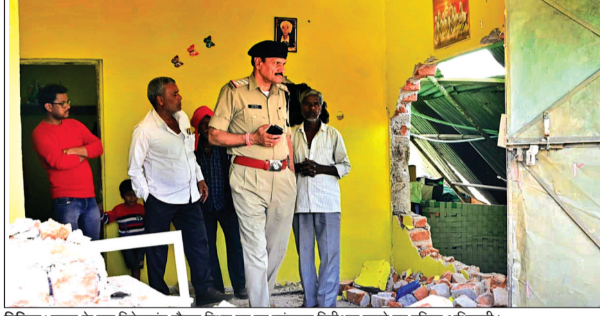
विदिशा। घटना के बाद विवेकानंद चौराहा स्थित घर पर पहुंचकर निरीक्षण करते हुए पुलिस अधिकारी।