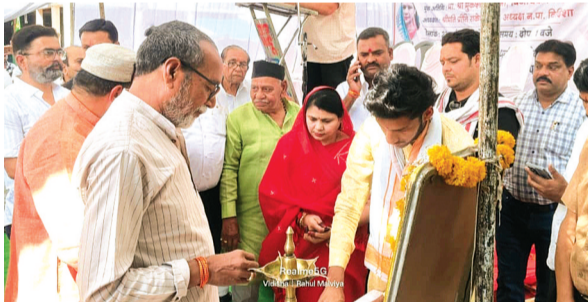
हरिभूमि न्यूज | विदिशा

सोमवार को विधायक निधि से वार्ड 14 और 16 की दो सड़कों का भूमिपूजन किया गया। वार्ड क्रमांक 16 में पेड़ी चौराहा से कार्तिक चौक होते हुए धर्म अधिकारी चौक तक डामरीकरण सड़क का निर्माण 6 लाख 65 हजार की लागत से किया जाएगा। वहीं वार्ड क्रमांक 14 एवं 16 में बजरिया चौक से इमामबाड़ा तक सड़क डामरीकरण कार्य 10 लाख 64 हजार की लागत से किया जाएगा।