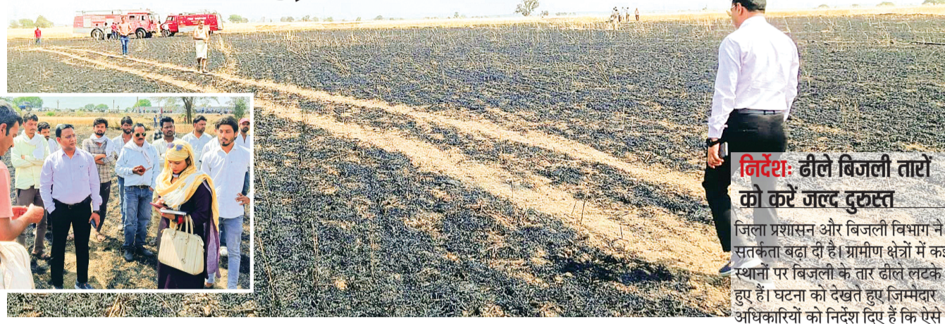
निर्देश: ढीले बिजली तारों को कड़े जल्द दुरुस्त