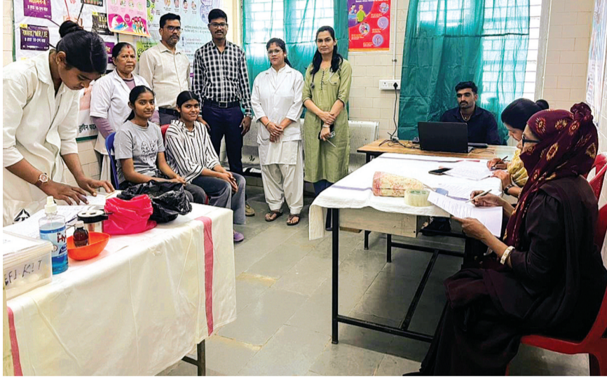
100 से ज्यादा बालिकाओं का वैक्सीनेशन का था टारगेट

इस भीषण गर्मी में नगर के पुराना अस्पताल में पदस्थ कर्मचारियों से बालिकाओं ने कहा कि हमें एचपीवी टीकाकरण करना है हमें जहां टीकाकरण के लिए राजीव गांधी चिकित्सालय भेज दो। जिस पर वहां पदस्थ कर्मचारियों ने बालिकाओं को मना करते हुए कहा कि हमारे पास आपको टीकाकरण के लिए बड़े अस्पताल भेजने की कोई व्यवस्था नहीं है। जिस पर बालिकाएं काफी परेशान होकर घण्टों बैठकर वापस लौट गईं। वहीं एक दो छात्राएं अपने निजी वाहनों से शासकीय राजीव गांधी चिकित्सालय पहुंचीं। जबकि शिक्षा विभाग के चार्टरड एग्जक्यूटिव पर यह सूचना जारी की गई थी कि नगर के कहरा बाजार स्थित पुराने अस्पताल में वैक्सीनेशन के लिए सेंटर बनाया गया वहां जाकर वैक्सीनेशन कराए।